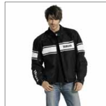
Venturi S2 textiel motorjack (heren)