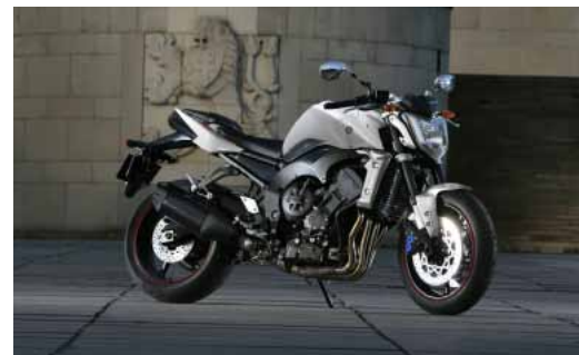
(getoonde model is de non-ABS uitvoering)

De FZ1 ABS - een gespierde bruutheid. Het gaat hier om volbloed motorfiets en laat daarover geen misverstand bestaan; bij de FZ1-serie ziet u meteen wat hij kan.