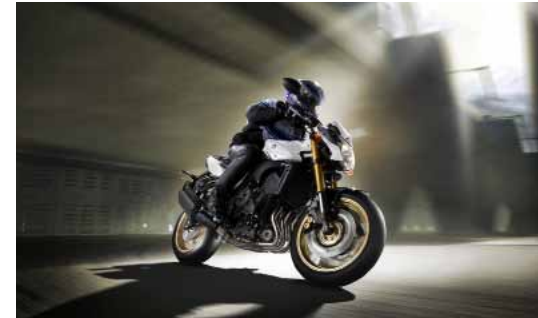
(getoonde model is de non-ABS uitvoering)

Het hart van de FZ8 ABS bestaat uit een veelzijdig en krachtig 779cc-motorblok met directe gasrespons en koppel bij lage toeren. Hij biedt volop power, power waar Yamaha bekend om staat. Licht, makkelijk wendbaar en een ergonomisch ontwerp maken dit tot de ultieme allround motorfiets.