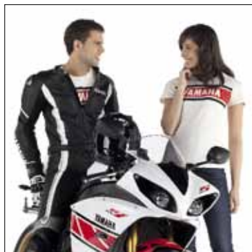
Speedblock lederen combipak (heren) & Classic T-shirt (dames)

Ga naar www.yamaha-motor.nl/accessories voor meer informatie.