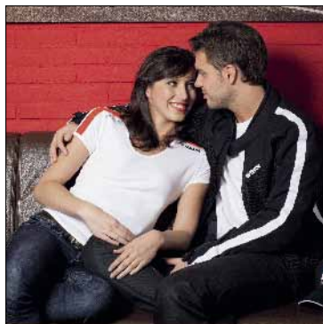
Iwata T-shirt (dames) & Iwata mesh motorjack (heren)